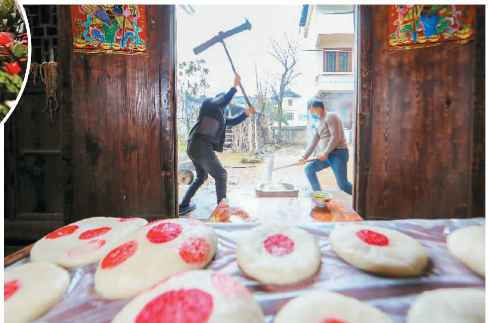
▲12月27日,贵州省黔东南苗族侗族自治州岑巩县水尾镇马家寨村村民打糍粑迎新年。