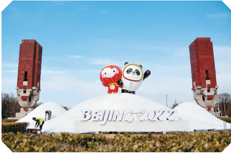
1月12日,在北京奥林匹克景观大道拍摄的北京2022年冬奥会和冬残奥会吉祥物“冰墩墩”“雪容融”。