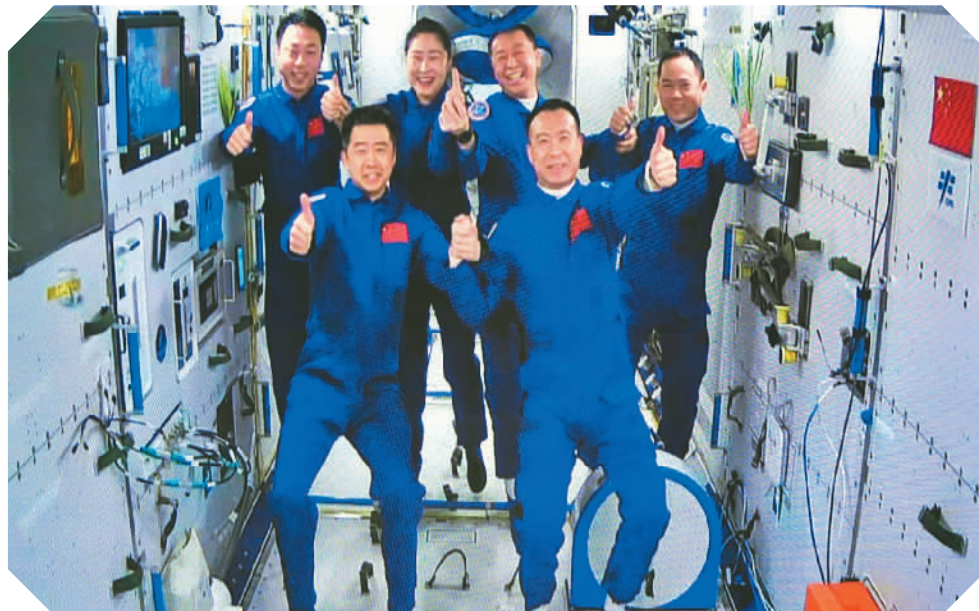
11月30日在酒泉卫星发射中心拍摄的神舟十五号航天员乘组与神舟十四号航天员乘组太空合影的画面。