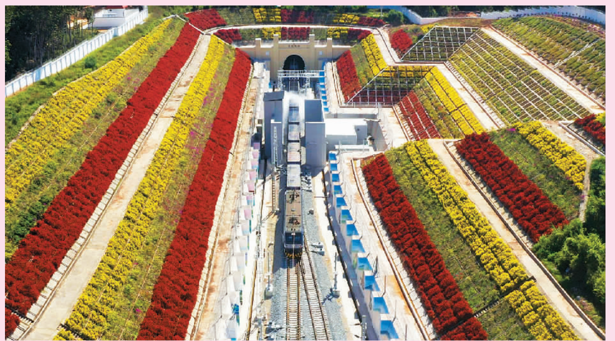
7月29日,一列从老挝万象发车的中老铁路“澜湄快线”国际货物列车驶入磨憨铁路口岸。