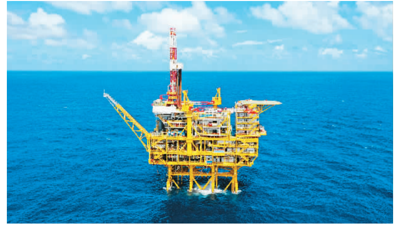
9月30日拍摄的深水导管架平台“海基一号”。

“2022,是怎样一段时光”“2022有你们多幸运”“2022最治愈你的是哪一刻”……连日来,大量有关“2022年”的话题,在新媒体上引发关注。