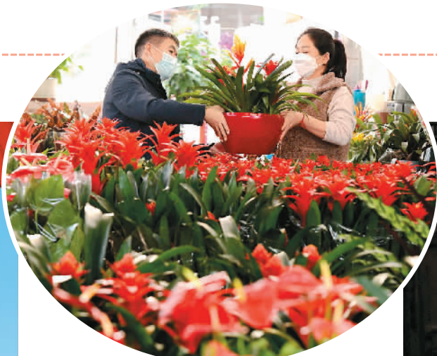
▲新年临近,各地花卉市场繁忙起来。因为12月27日,河北省石家庄市市民在一家市场选购花卉。