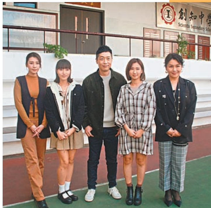
◆馬仔(中)透露明年大計集中進修和工作。