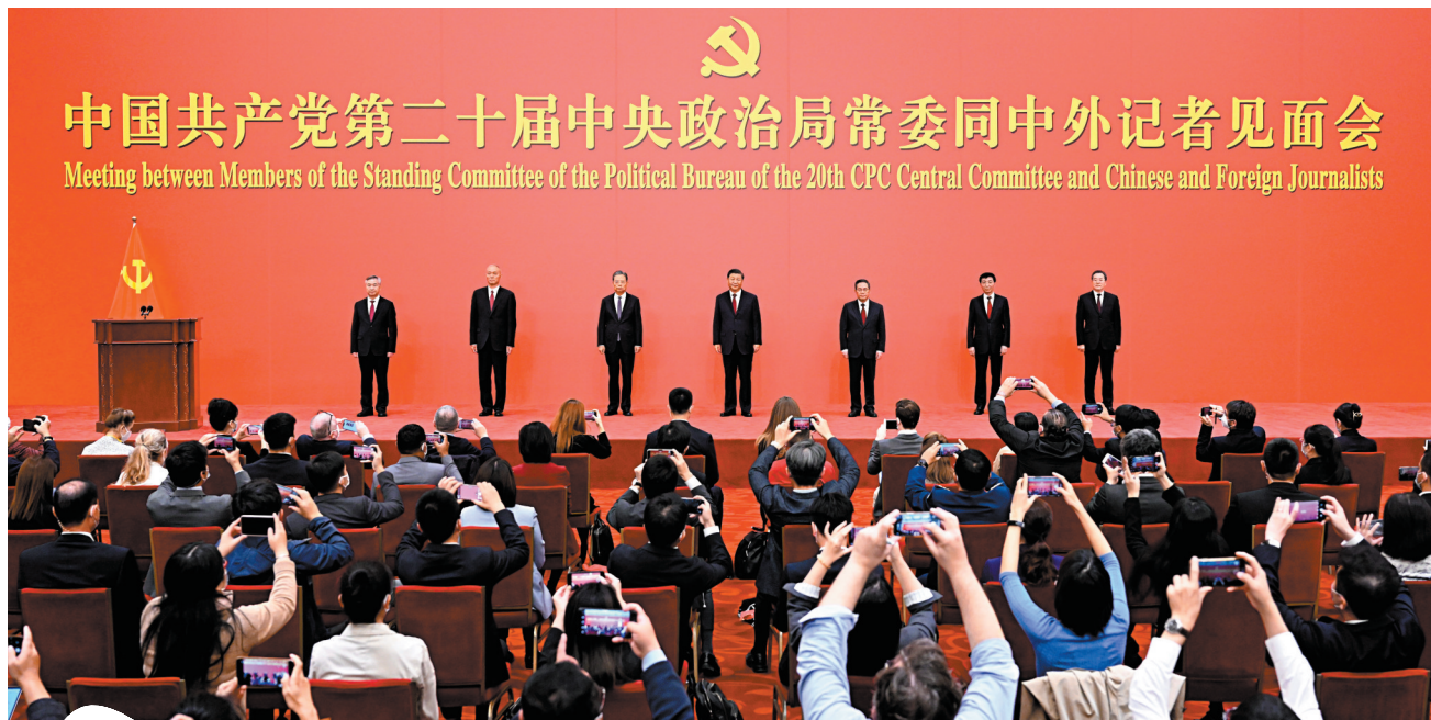
中国共产党第二十届中央政治局常委同中外记者见面会 Meeting between Members of the Standing Committee of the Political Bureau of the 20th CPC Central Committee and Chinese and Foreign Journalists

今日本報刊出的「十大中國新聞」與另版刊登的「十大國際新聞」，均按照新聞事件發生時間順序排序。