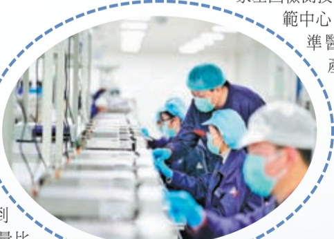
生物醫藥產業異軍突起

從「鋼筋鐵水」到「繁花似錦」，大渡口區從未放緩過發展的步伐，一直以產業發展為抓手，大力拓展新興產業，實施結構重構，培育出大數據智能化、大健康生物醫藥、環保產業、新材料產業和重慶小麵產業五大百億級產業集群，力爭讓曾經的老工業基地轉型成為近悅遠來的產業花園！