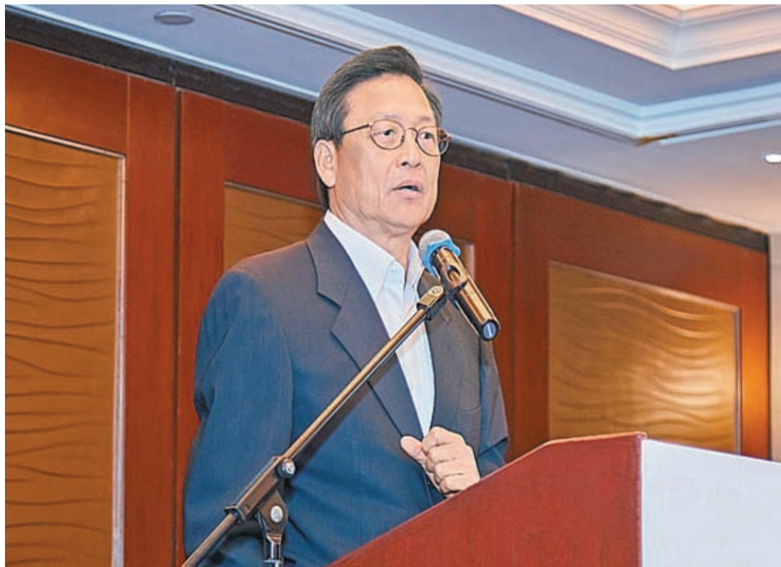
黃建業料樓市徹底復甦仍須待香港和內地全面通關、經濟復甦、市民信心恢復，以及息口見頂。

黃建業強調，樓價大幅直插實屬非常不健康。樓市價量急跌拖累經濟，勢必推高失業率及商舖空置率，令市面更蕭條。