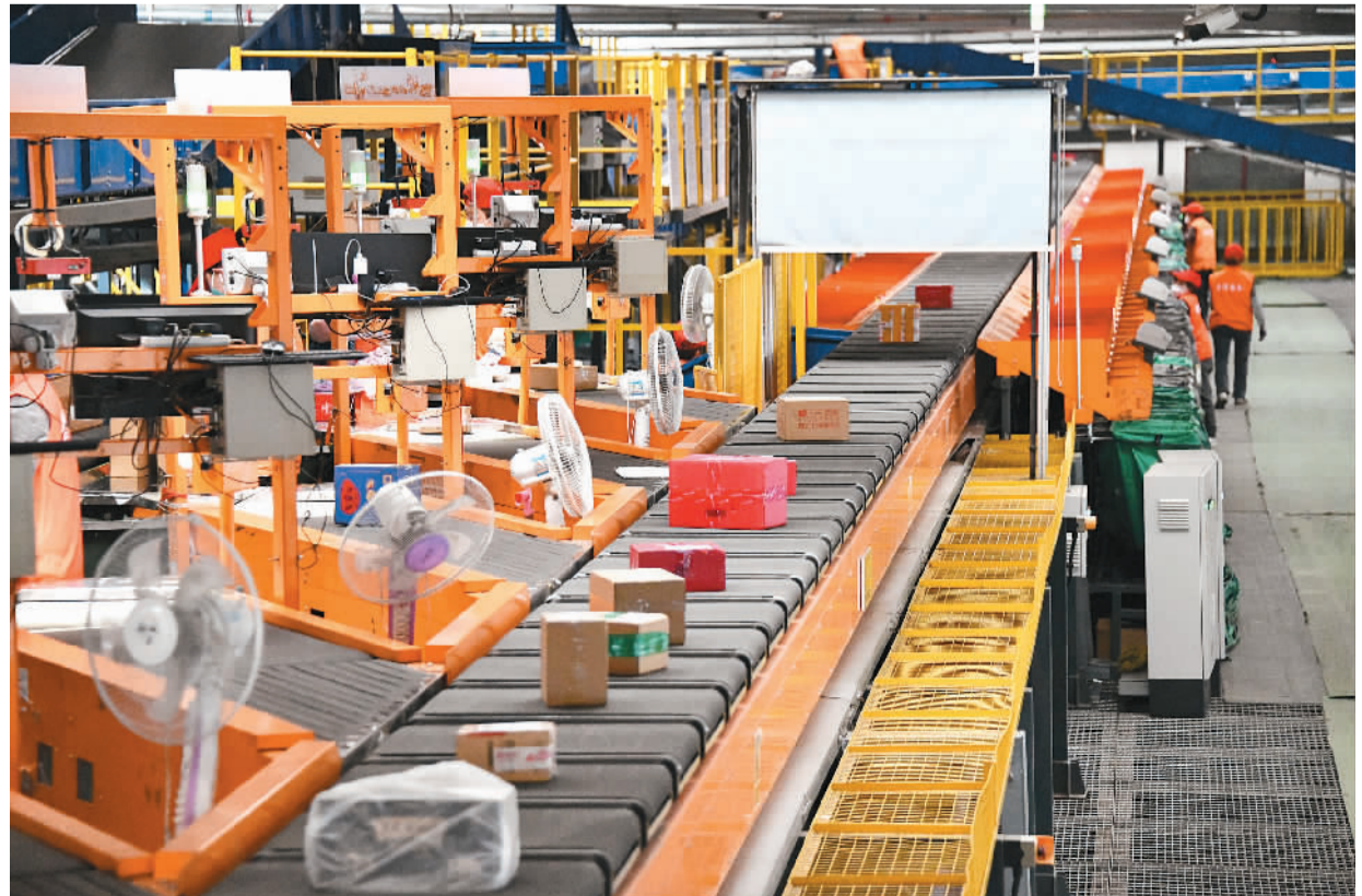
12月13日,中国邮政兰州中川邮件处理中心通过物联网、大数据分析、无接触式供电等技术手段,进行智能化邮件处理。