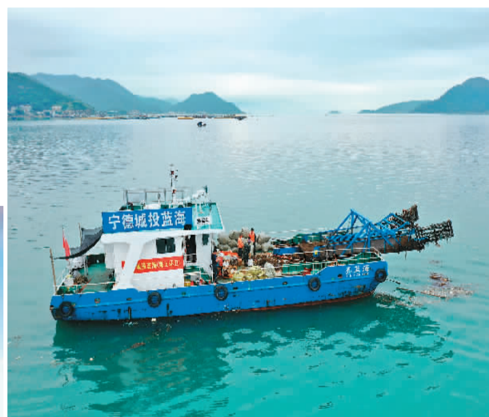
▲ 近年来，福建统筹推进从严管海、科学治海、系统护海，在更高起点上追求百姓富、生态美的和谐并进。图为机械化打捞船在宁德市三都澳海域清理海漂垃圾。