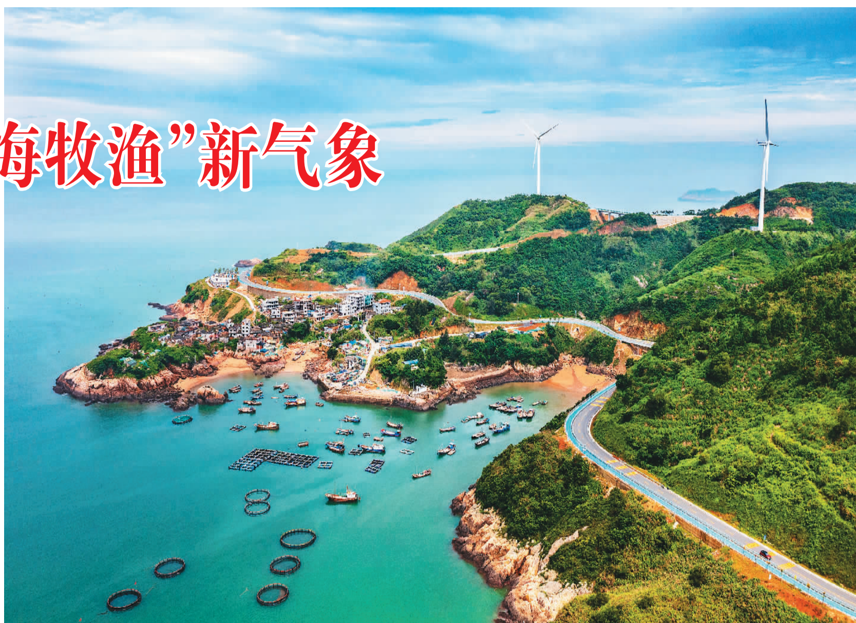
▲ 宁德市霞浦县积石至间峡段宛如一条灵动的绸带，沿海岸线蜿蜒，美若画卷。