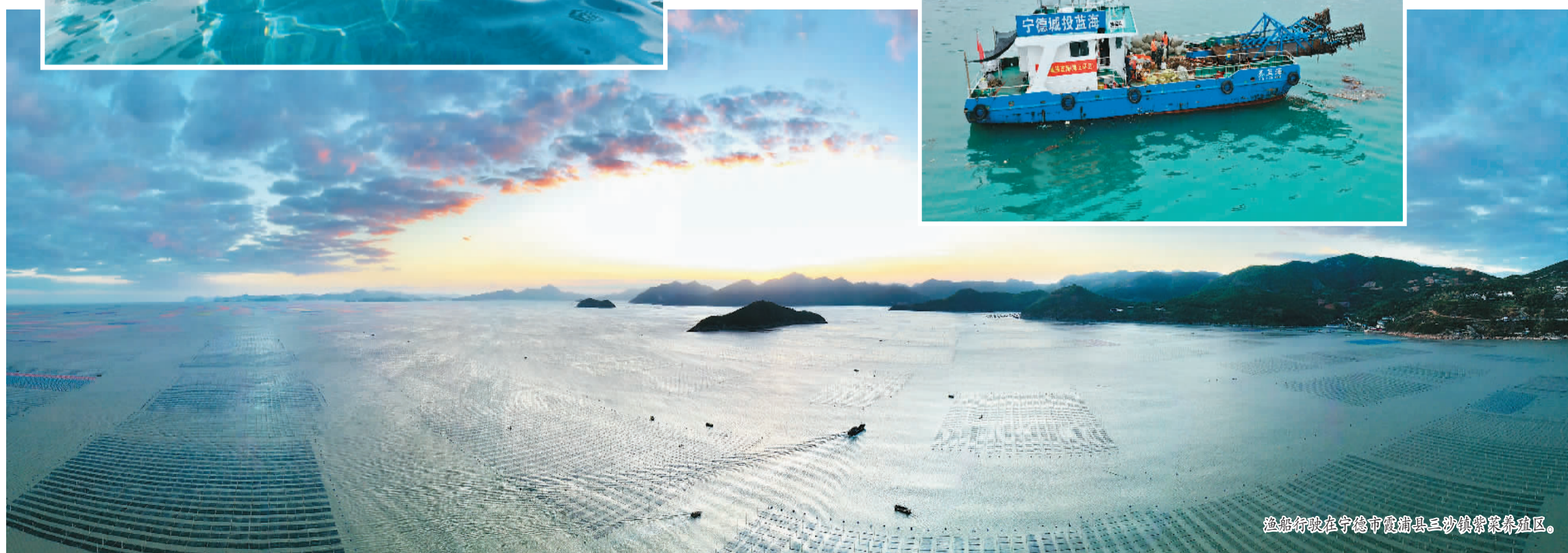
渔船行驶在宁德市霞浦县三沙镇紫菜养殖区。