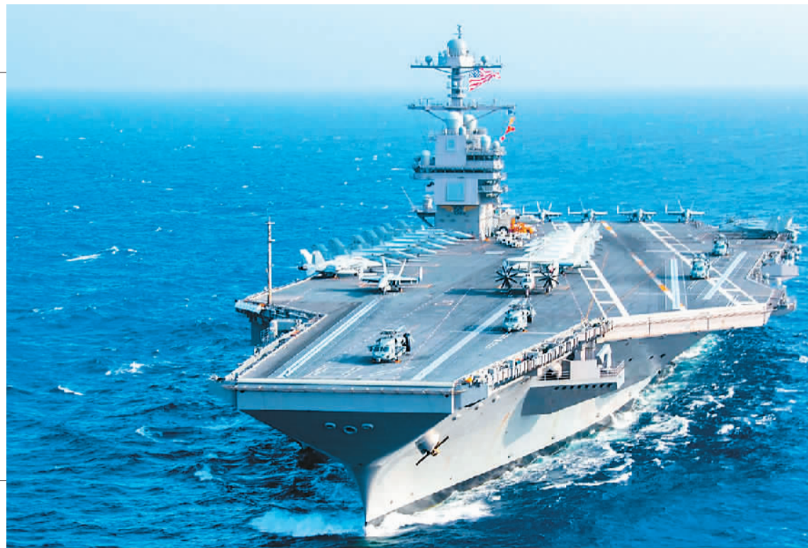
美国海军“福特”号航母。

美国国会参议院近日表决批准2023财年《国防授权法案》。法案授权的2023财年国防经费达到创纪录的8579亿美元，超出美国总统拜登提出的国防预算申请450亿美元，较前一财年的授权额度增加800亿美元。参议院军事委员会称，2023财年国防授权法案关注美国同中国及俄罗斯“战略竞争”、发展“颠覆性技术”、升级装备等内容。