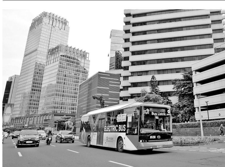
明年雅京将增加190辆电动巴士 为支持雅加达空气素质更具环保条件,TransJakarta公司明年将增加190辆电动巴士。

100盾,就对通货膨胀产生了很大的影响,现在更何况涨价了1000盾。而且大米的供应和价格的稳定,关系到许多人的生活,其战略意义非常大。”(Sm)