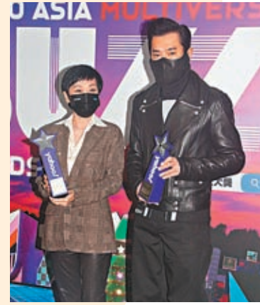
◆張艾嘉和古天樂現身獲頒獎禮。