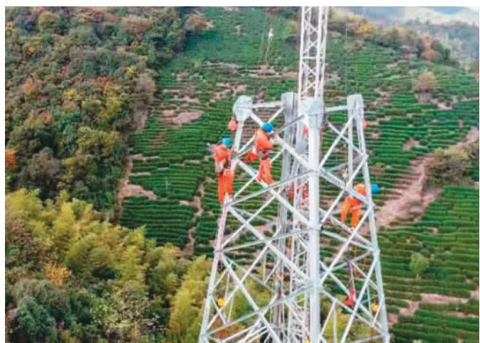
金山110千伏输电工程是浙江省湖州市长兴县“十四五”电力升级改造重点工程之一。新建配套输电线路将为当地旅游业发展注入优质电能,助力乡村振兴和共同富裕。图为国网长兴供电公司电力员工正在协助相关人员进行铁塔立塔作业。

据悉,此次将采取多种途径进行排查,包括座谈走访、信访渠道、舆情监测等,在全面广泛深入排查的基础上,形成问题清单,并分析原因,明确解决措施。