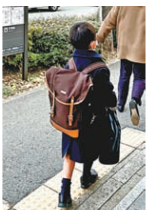
◆日本小孩獨自放學上落地鐵，天生矮小，還是歲數如身形頂多不夠6歲，父母怎得放心？

身邊也有政治立場中肯的朋友，為求方便，參加了英國於年前推出的BNO 5+1計劃；不少人，包括筆者不停警告：人家換一個總理轉一個國策，如若新上任的話事人推翻前人的決定，站在十字路口曾經毅然放棄香港事業與朋友家人，將來有什麼負面變數，如何回頭