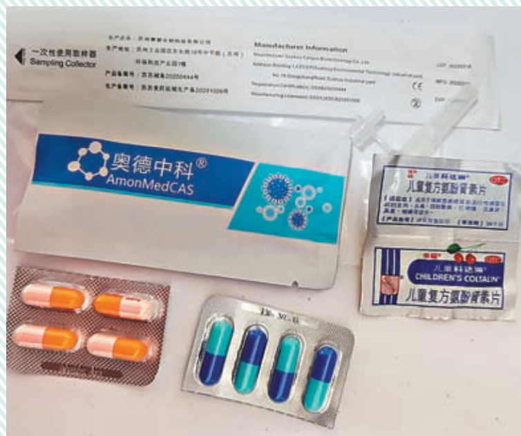
◆熱心鄰居分享的藥品和抗原。