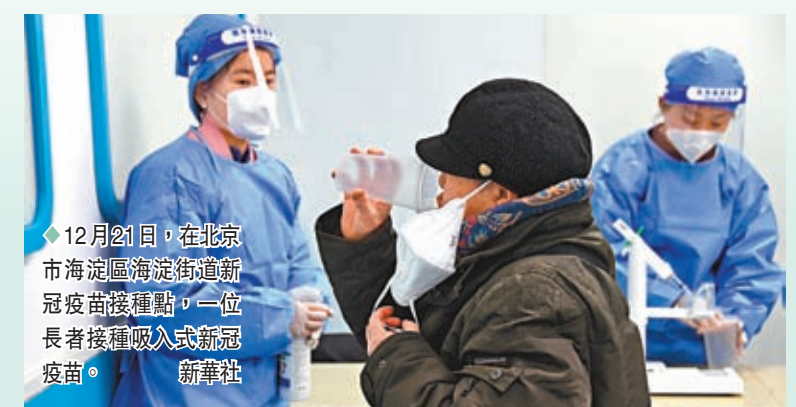
◆12月21日，在北京市海澱區海澱街道新冠疫苗接種點，一位長者接種吸入式新冠疫苗。

香港文匯報訊 據中新社報道，根據中國國家衛生健康委員會網站22日消息，國務院聯防聯控機制醫療救治組21日召開全國電視電話會議，指導各地做實做細新階段新冠肺炎疫情醫療救治工作，堅決守住人民生命安全和身體健康底線。會議強調，三級醫院要兜住醫療救治和生命保障的底線，全力做好老年和兒童重症患者醫療救治。