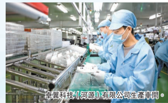
卓翼科技（河源）有限公司生產車間。