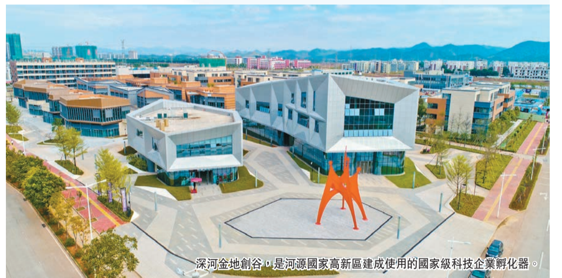
深河金地創谷，是河源國家高新區建成使用的國家級科技企業孵化器。

當工業園區擁有堅實的產業基礎，便有了持續發展的原動力。作為粵東西北地區首個國家級高新區，今年1-10月，河源國家高新區電子信息產業產值和增加值分別為306.4億元、76.7億元，同比增長5.1%、6.7%；食品飲料和水經濟產業產值和增加值分別為34.4億元、15.1億元，同比增長11.8%、13.1%；機械與模具產業產值和增加值分別為30.2億元、8.1億元，產業集群質量有效提升。