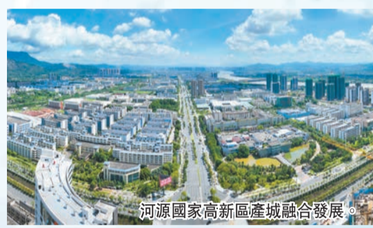
河源國家高新區產城融合發展。