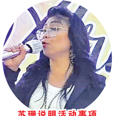
苏珊说明活动事项