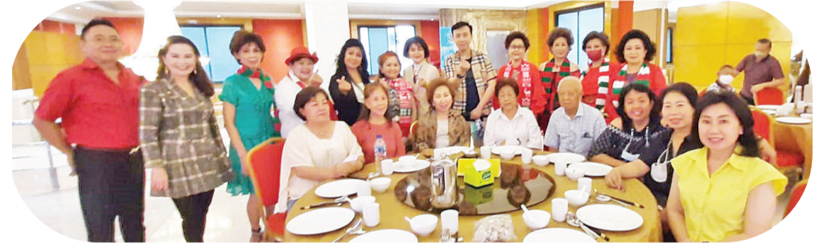
美妙歌声中传友情