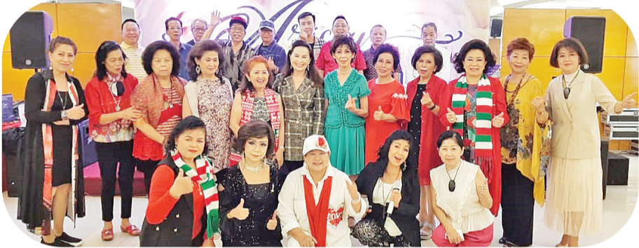
美妙歌声中友情合照