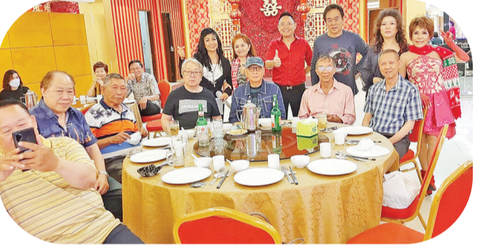
美妙歌声中传友情