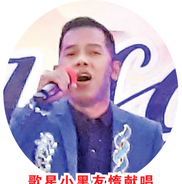
歌星小黑友情献唱