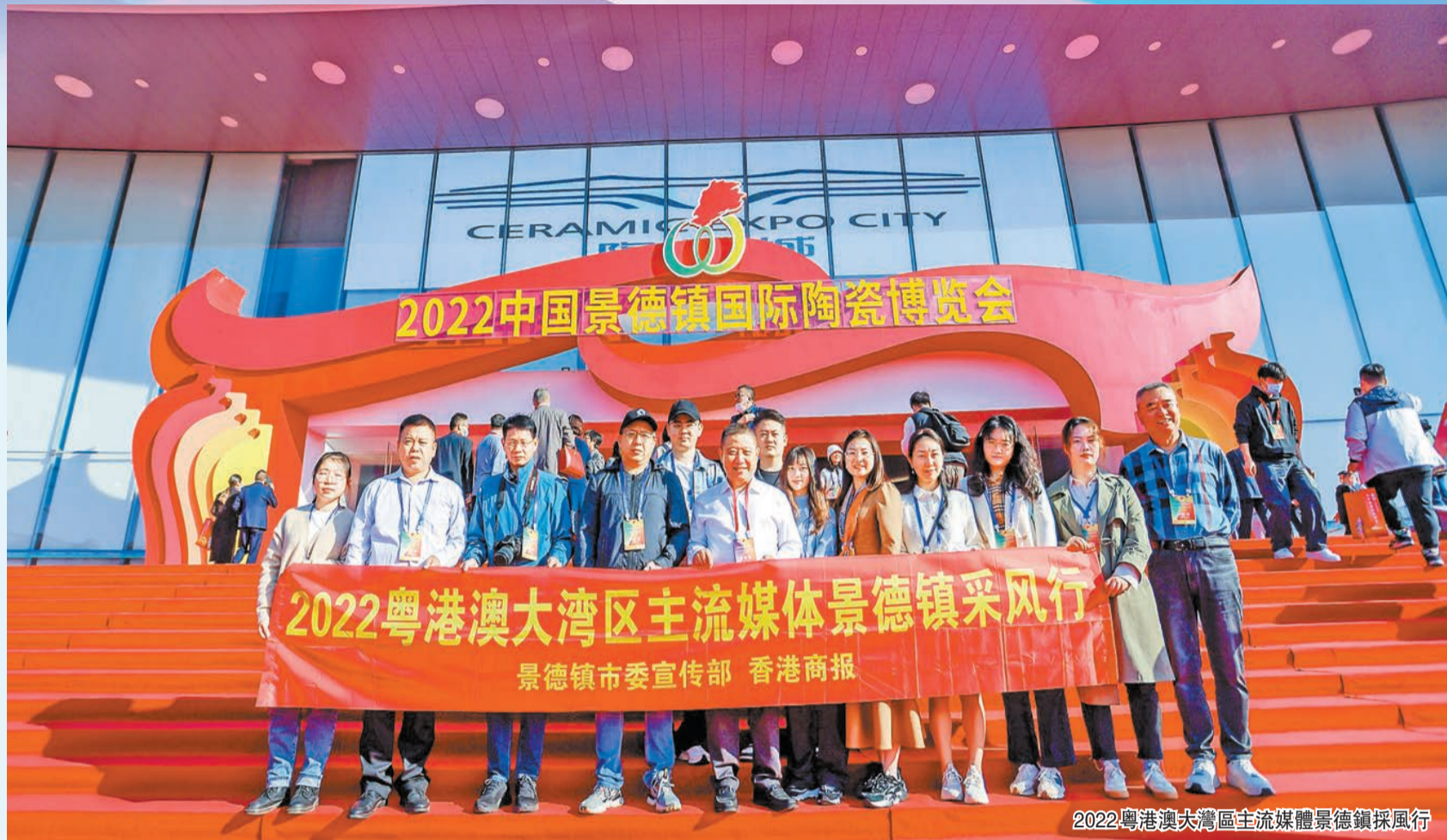
2022粵港澳大灣區主流媒体景德鎮採風行