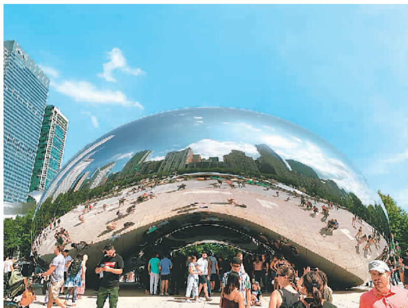
图为芝加哥千禧公园地标雕塑“云门”。