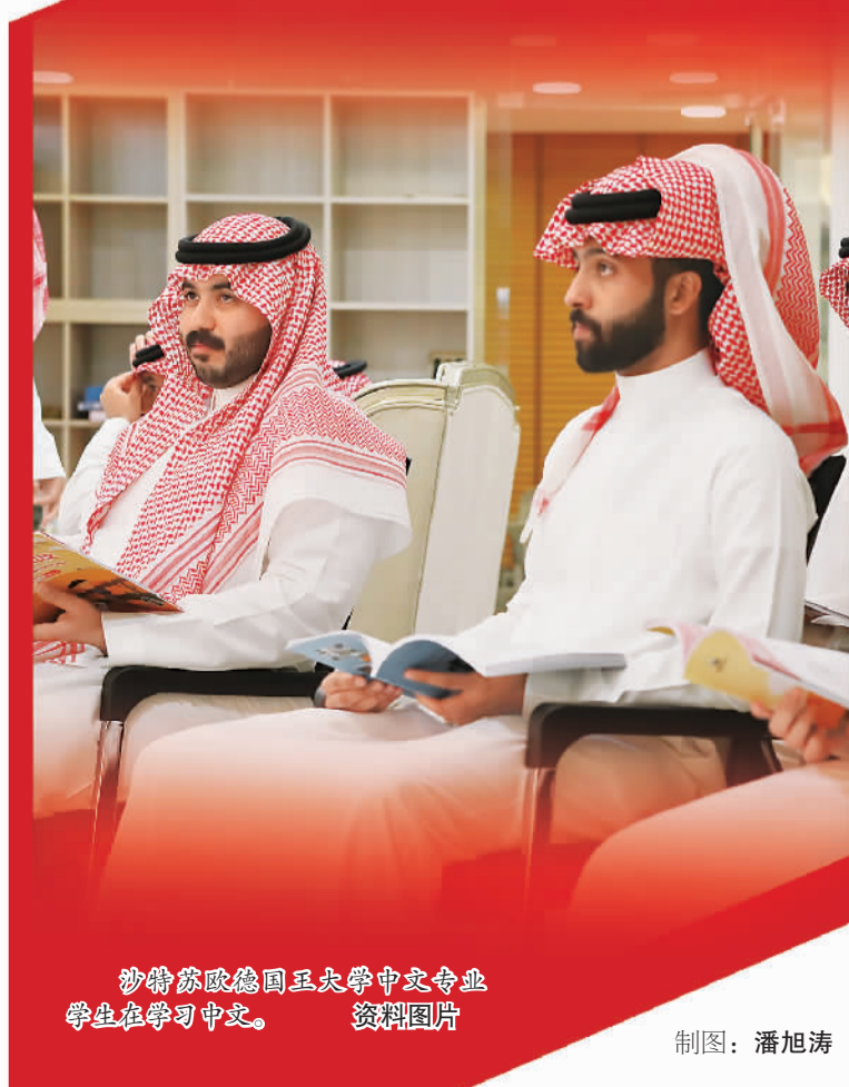
沙特苏欧德国王大学中文专业学生在学习中文。资料图片