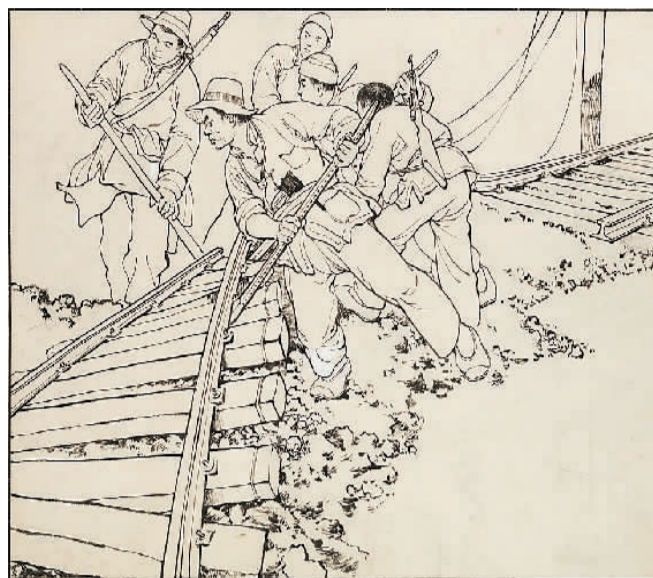
▲铁道游击队(连环画) ▲黄河(连环画)