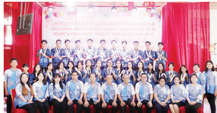
山口洋教师联谊会华文补习所第四届初中毕业班师生合影