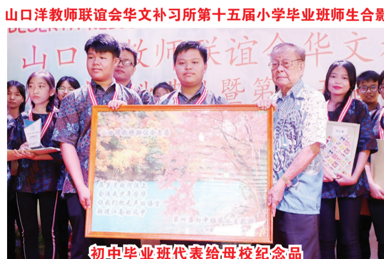
山口洋教师联谊会华文补习所第十五届小学毕业班师生合影

努力,毕业不代表结束学业,而是另一个学习领域的开端。这两位老师是本校的精英,他们知识面大,教学经验丰富,是其他教师的楷模。最后上台讲话的就是两班毕业班代表和留校生代表了。他(她们)都以很棒的思维和标准流利的语言及语音表达出对毕业同学的祝福和对留校同学的鼓励和希望。