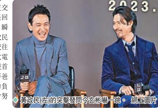
◆黃政民(左)的突擊發問令玄彬嚇一跳。

玄彬跟孫藝珍2018年合作電影《協商》，外界也以為這是2人的「定情作」，玄彬指當時是演綁架犯，而《交涉》雖然也是和綁架有關，但與《協商》時的角色有很大不同，玄彬表示太太孫藝珍沒有給予意見，爆笑的是，黃政民此時突然好奇提問：「那時候《協商》還沒交往嗎？」玄彬瞬間慌張回答：「那時候還沒交往，瞬間以為你是記者。」黃政民親自為大眾解惑兩人的交往時間點，逗笑全場。今次電影發布會也是玄彬當爸後首度現身，不免被問到新手爸爸心情，他坦言肩膀的負擔確實變重了，未來會努力當一位好爸爸。