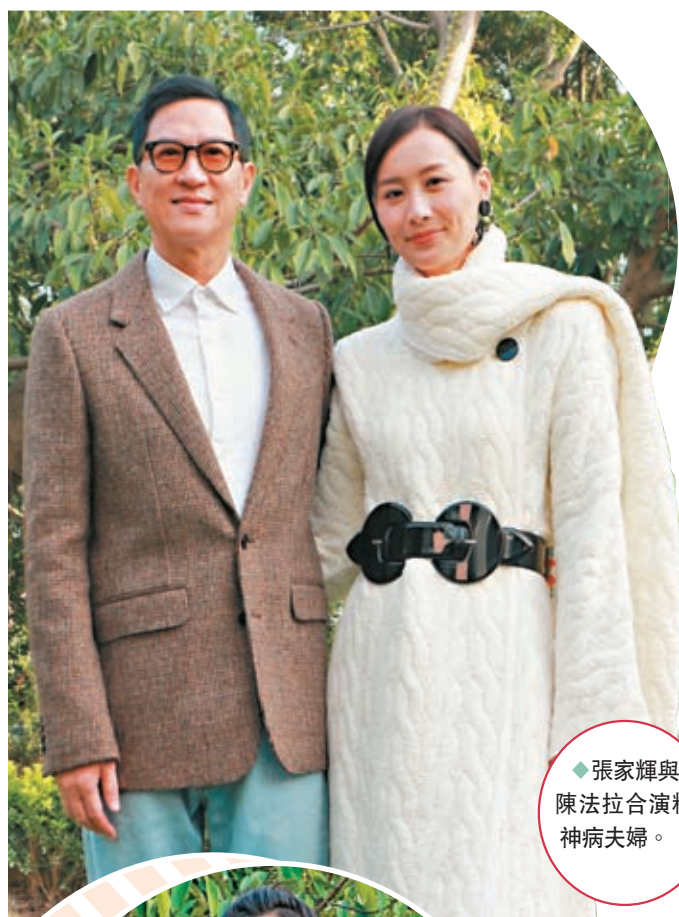
◆張家輝與陳法拉合演精神病夫婦。