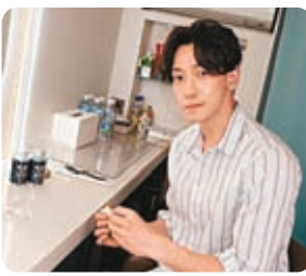
◆ Rain 相隔3年多再度來港。網上圖片