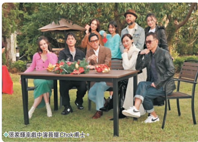
◆張家輝率領中演員擺Chok甫士。