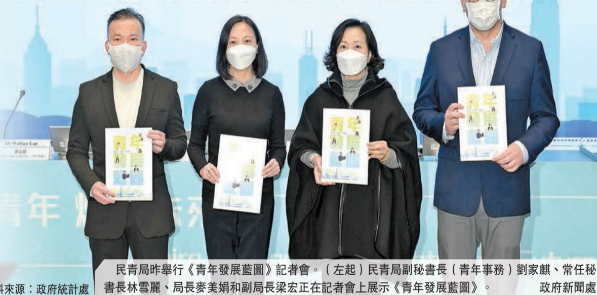
民青局昨舉行《青年發展藍圖》記者會。（左起）民青局副秘書長（青年事務）劉家麒、常任秘書長林雪麗、局長麥美娟和副局長梁宏正在記者會上展示《青年發展藍圖》。