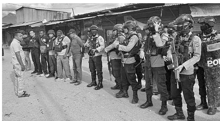
警方控制了巴布亚多利卡拉县(Tolikara)的局势