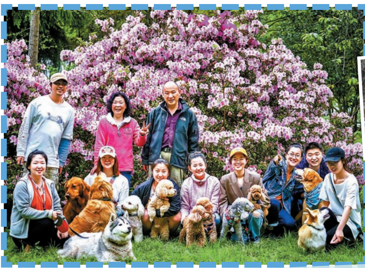
◀中國養寵人群急速增加，催生出寵物出行、寵物醫療、寵物食品等寵物細分行業。圖為浪小爪組織的寵物旅行活動。