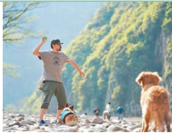
◆主人與寵物在玩耍。

穩定成熟期：2021至今 疫情作為新形態可能長期伴隨人類，刺激了人們養寵的心理；寵物數量保持穩定增長，寵物家庭飼養率逐步提升；行業逐漸發展出覆蓋寵物全生命週期服務的產業鏈；線上線下全渠道模式逐漸完善，市場走向成熟。