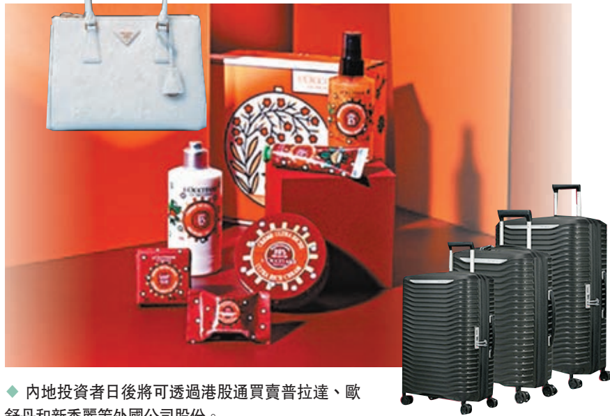
◆ 內地投資者日後將可透過港股通買賣普拉達、歐舒丹和新秀麗等外國公司股份。

滬深港通進一步擴容，中國證監會及香港證監會19日聯合公告，同意香港和內地交易所進一步擴大股票互聯互通標的範圍，包括符合有關條件在港主要上市外國公司股票將被納入港股通標的。換言之，內地投資者日後將可透過港股通買賣普拉達、歐舒丹和新秀麗等外國公司股份。港交所表示，將與兩地的業務夥伴緊密合作，為落實此次擴容方案積極推進各項準備工作，預計需要3個月左右的準備時間。