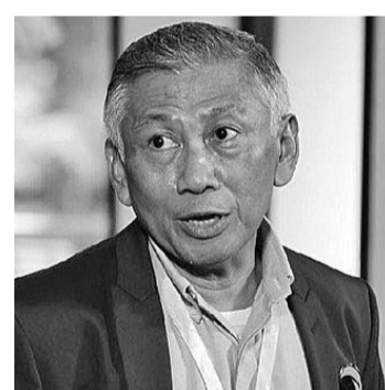
民族民主党中央理事会主席阿芬迪

【本报讯】民族民主党中央理事会主席阿芬迪(Effendi Choirie)否定推选前任雅京专区省长阿尼斯为准总统候选人进退维谷的指控。原因是,民族民主党自推选阿尼斯为2024年准总统候选人以来一直吹捧的“变革”受到各方质疑,因为据称,阿尼斯是想继续佐科维的兴国计划。阿芬迪周一(19/12)指出,变革是在维新的框架内,而不是革命。革命表示发生剧烈的变化,可以推翻现有的或既定的制度。在维新的框架内“变革”的含义是纠正坏的,恢复失去的良好价值观或历史,恢复不太稳定、不成比例或不太公正的情况。阿芬迪表示,民族民主党希望启迪和稳定我国人民的生活。我们恢复、我们稳定、我们正常化、我们公平化,开导那些悲伤、悲观、无知和愚昧的生活,总是消极地思考问题。我们开导所有人,以便全国人民的心灵、心理、精神,以及行为更精神、更乐观、更聪明、更积极,并且总是尊敬和赞赏。阿芬迪强调说,民族民主党提出的维新变革概念