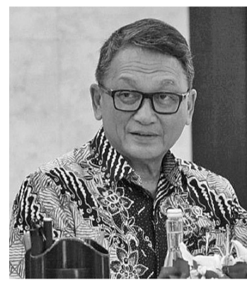
能源与矿务部长阿里芬

【本报讯】能源与矿务部长阿里芬就政府将提供电动车辆补贴的构想发表了讲话。阿里芬周五(16/12)表示,这种补贴确实是使环保车辆的使用更有效,这是很有必要的。如果不这样做,民众会对环保程序不感兴趣。许多新摩托车都有资金补贴,电动汽车用户应该更高。政府也在将二手摩托车从燃油转换为环保电动汽车进行宣传。这些数字是需要再次商定的,因为我们想要发给二手摩托车主与弱势群体,这些人拥有的都是旧摩托车。能买新车的都