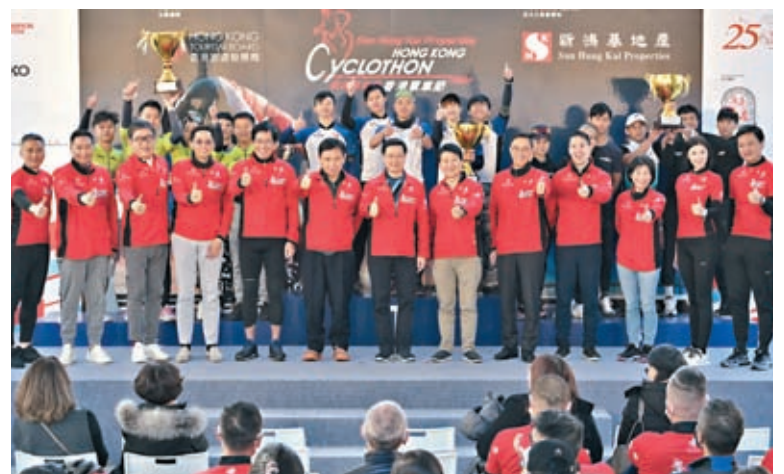
◆李家超出席香港單車節頒獎典禮。

香港文匯報訊(記者 唐文)香港單車節順利舉行，正是香港穩步復常的重要指標。香港特區行政長官李家超在出席單車節的頒獎禮上致辭時表示，香港得以再度舉辦這項全城矚目的盛事，展現香港的活力和非凡魅力，更形容即使18日天氣寒冷，「我身處這裏也完全能夠感受各位血脈沸騰，全情投入。」他並指，隨着逐步恢復舉辦多項大型活動，證明香港已重返世界舞台，相信隨着各項措施因應疫情發展靈活解除，旅客入境數字將快速急升，香港可在盛事之都的美名下吸引不同的旅客，以香港作為他們的旅遊首選地。