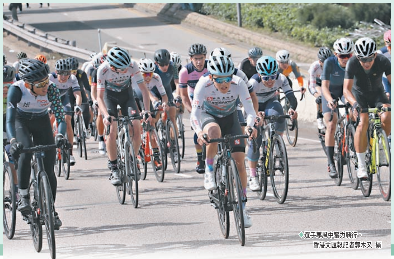
◆選手寒風中奮力騎行。