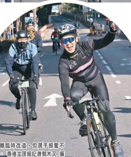
◆雖臨時改道，但選手振奮不減。