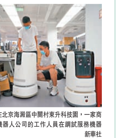
◆在北京海峽區中關村東升科技園，一家商用機器人公司的工作人員在調試服務機器人。

另外，北京、粵港澳大灣區、上海這三個中國規劃建設的國際科技創新中心全部進入前十名，粵港澳大灣區首次超越東京灣，成為亞洲新的價值鏈中樞。同時，共有19個中國城市(都市圈)進入全球百個創中心城市榜單，表明中國城市整體科技創新能力正在持續提升。