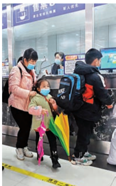
◆12月18日，交通運輸部發布通知，全面恢復道路客運服務，民眾出行不再查驗核酸。

香港文匯報訊 綜合報道，隨着內地防疫措施的調整優化，2023年春運迎防疫三年來最大的一波「返鄉潮」。中國交通運輸部18日對外公布，全面恢復道路客運服務，嚴格落實對旅客不再查驗核酸檢測陰性證明和健康碼、不再開展「落地檢」等相關規定。同時，明確多條精準實施疫情防控和保護措施，以及高效開展涉疫應急處置，確保重點客運站「不關停」、主要客運線路服務「不中斷」。有在粵務工人員坦言，此舉讓更多外來工過年返鄉之路更有保障。交通運輸部日前印發的《關於加快推進道路客運復工復產保障人民群眾平安健康順暢舒心出行有關事項的通知》要求，精準實施疫情防控和保護措施，全面恢復道路客運服務，更好滿足人民群眾出行需要。