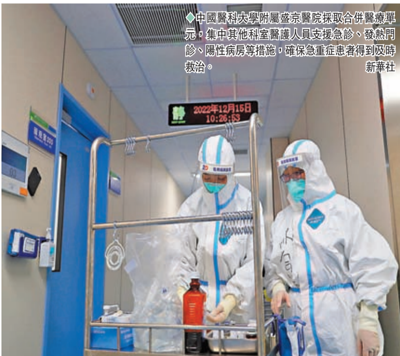
◆中國醫科大學附屬盛京醫院採取合併醫療單元，集中其他科室醫護人員支援急診、發熱門診、陽性病房等措施，確保急重症患者得到及時救治。

其中，天津濱海新區急救中心建議，陽性感染者，如果有以下症狀，比如出現休克、抽搐，呼吸困難或氣促，失語或不能行動，精神狀態明顯改變，持續不能飲食或嘔吐、腹瀉超過兩天，孕婦的胎兒活動減少或停止，這些都屬於急危重症情況，需要撥打120緊急就醫。北京急救中心主任醫師陳志介紹，120系統主要用於對突發疾病導致的危重症病人或者因意外事故、災難等導致的人身傷害的緊急救助，凡是不在這個範圍之內的都不是撥打120的範疇。