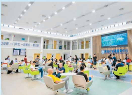
前海e站通服務中心。

前海全面深化改革，堅持「先行先試、邊行邊試、合作共試」，去年以來，新推出制度創新成果115項、累計725項，新增全國複製推廣7項、累計達72項，以制度創新為核心的前海模式進一步夯實。如發布全國首個《基於跨境活動的企業信用報告格式規範》，《大宗貨物電子倉單》等標準獲國家發改委批