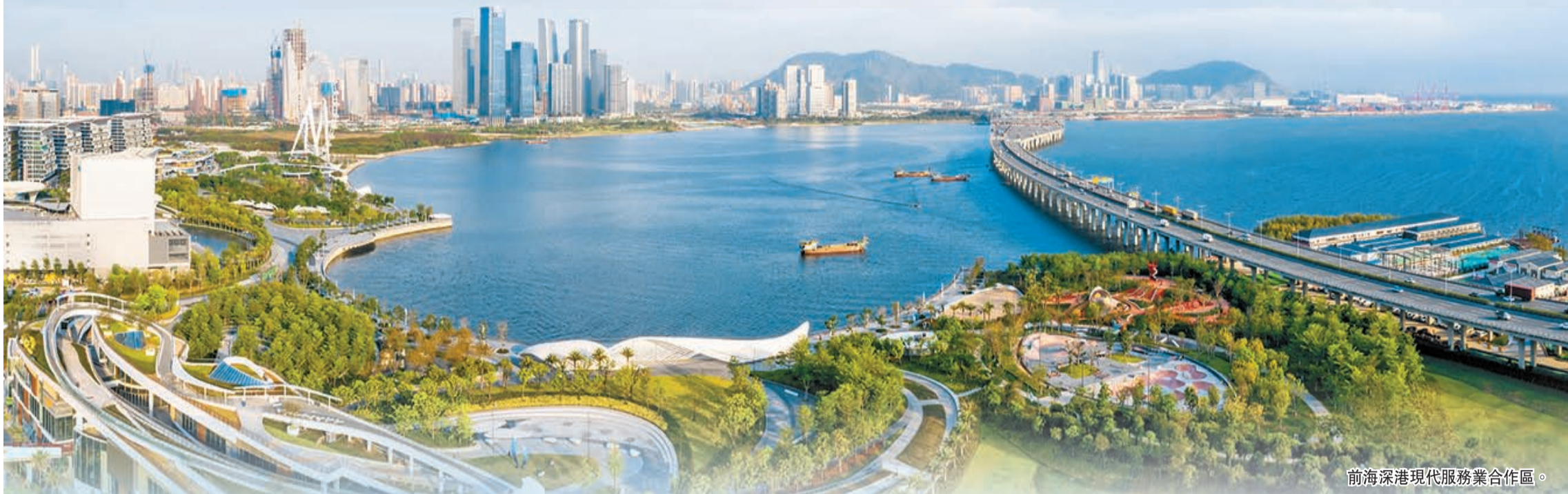
前海深港現代服務業合作區。

前海是習近平總書記一手締造的改革開放典範，是習近平新時代中國特色社會主義思想的精彩演繹。開發建設前海深港現代服務業合作區，更是支持香港經濟社會發展、提升粵港澳合作水平、構建對外開放新格局的重要舉措。前海一直秉持着「依託香港、服務內地、面向世界」的初心，始終把全面推進深港合作放在首位，打造香港融入國家發展大局的「橋頭堡」。 歷經十二載，全方位推進深港合作走深走實，打造出了一