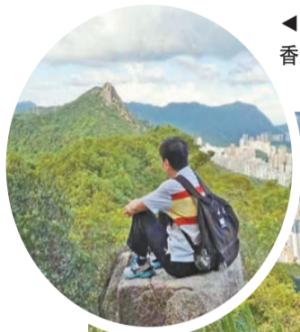
◀行山達人登頂香港筆架山。