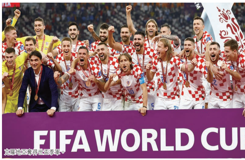
克羅地亞奪得世盃季軍。

據了解，SF、SG匝道作為廣州白雲站南樞紐立交匝道，承擔站場南平台與市區方向的交通功能。這座跨京廣鐵路曲線轉體橋是世界首個岩溶地區轉體重量超2萬噸、轉體角度超102度的三維非對稱曲線轉體橋，長度為165米，與京廣鐵路下行線以87度交叉角相交，臨近運營鐵路線小於5米並跨越11股道，國內外尚無施工先例。