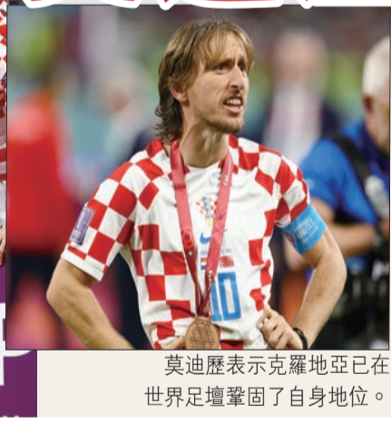
莫迪歷表示克羅地亞已在世界足壇鞏固了自身地位。

【多哈18日綜合電】克羅地亞(格仔軍團)在周六上演的世盃季軍戰，憑着加華度爾、米斯拿夫柯錫士上半場各建一功，最終以2比1擊敗摩洛哥(亞特拉斯雄獅)，奪得季軍。隊長莫迪歷賽後表示，將踢到2023年，目標是率領克羅地亞(格仔軍團)奪得歐洲國家聯賽(歐國聯)冠軍。