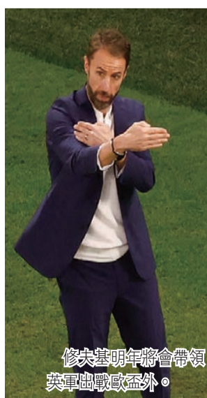
修夫基明年將會帶領英軍出戰歐國盃外。

【倫敦18日綜合電】英格蘭足球總局周日確認，修夫基將會繼續出任英格蘭(三獅軍團)的領隊，直至2024年歐國盃結束。在英格蘭以1比2負於法國，止步今屆世界盃8強之後，修夫基曾經表示對是否繼續執教三獅軍團感到「困惑」。現年52歲的修夫基在2016年開始出任英格蘭的領隊，曾帶領球隊晉身2018年世界盃4強，並於2021年舉行的歐國盃歷史性躋身決賽。