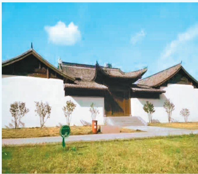
上图：罗峰书院。 右图：国安寺一隅。