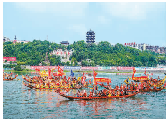
安康汉江龙舟节吸引了各地游客。

进展览馆体会乡村民俗文化，去古建遗址感受历史的沧桑，逛农村大集购买生态的特色农产品……如今，许多游客去陕西安康的乡村旅游，不仅能采摘、观景、学习稼穡，还能进行深度文化旅游。