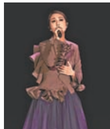
◆千嬅一身紫色裙裝高貴亮相。