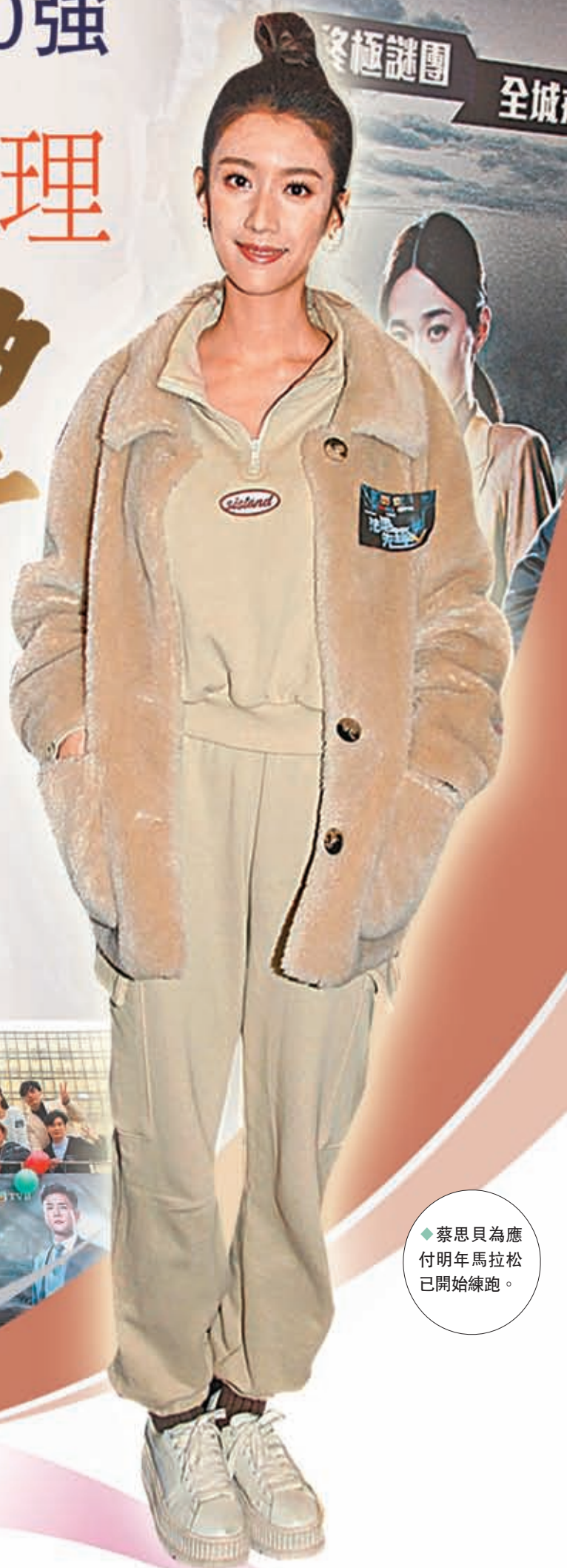
◆蔡思貝為應付明年馬拉松已開始練跑。