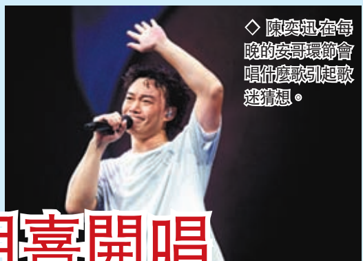
◆ 陳奕迅在每晚的安哥環節會唱什麼歌引起歌迷猜想。