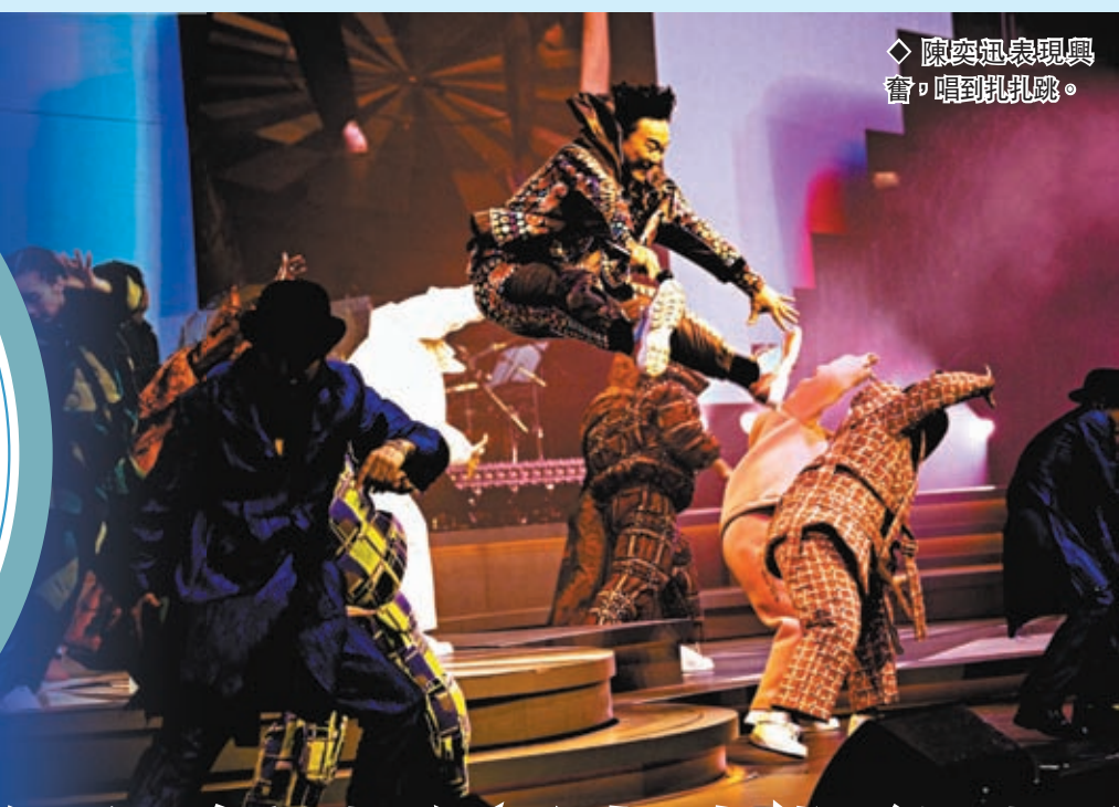
◆ 陳奕迅表現興奮，唱到扎扎跳。

香港文匯報訊 (記者子棠) 陳奕迅 (Eason) 14日晚舉行的第五場演唱會，獲觀眾開電話燈滿天星海為他打氣，令Eason感動得紅着淚眼，要走向台底冷靜情緒才能繼續演唱。Eason又主動走上舞台最高位跟山頂朋友打招呼，但「落山」時險發生意外，而到了安哥環節，全場七千人一齊大合唱《K歌之王》，Eason唱了幾句已想流淚。