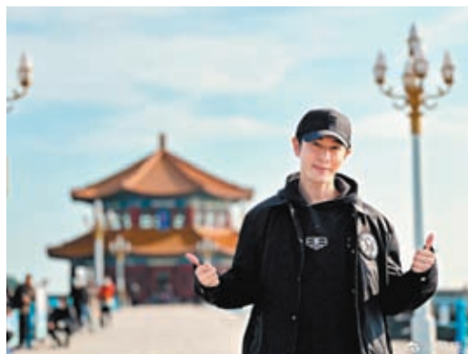
◆ 黃曉明透露睇球睇到頸痛。

香港文匯報訊 (記者文芬) 2022卡塔爾世界盃就像放煙花一樣，精彩紛呈，但轉眼間已進入尾聲。不少香港球迷熬夜睇球，而內地藝人黃曉明也不例外，他還把脖子都扭痛了！ 黃曉明14日在微博發了一張阿根廷球王美斯的照片，並發文：「這幾天看球的時候突然發現自己希望那邊進球，頭就會往進攻的球門方向一偏一偏的，一場球下來脖子都扭痛了，這是什麼毛病啊，求藥方。」 最後，黃曉明也不忘向自己支持的球隊隔空打氣，「恭喜阿根廷進決賽！梅西 (美斯) 加油！」足見他十分關注今屆世界盃。阿根廷對法國的世界盃決賽將於香港時間星期日 (18日) 晚11時舉行。