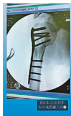
▲ 從X光片可見，林志穎的右手支撐着，內藏多支鋼釘。