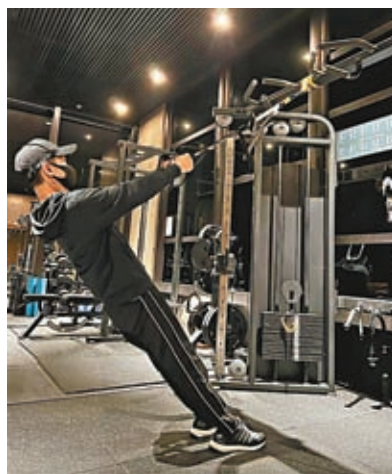
▲ 林志穎已加強復康訓練。

香港文匯報訊 台灣藝人林志穎於7月22日，駕駛自己的Tesla電動車在桃園發生嚴重交通意外，導致右手骨折，還有顱內出血及輕微腦震盪等情況，他大難不死之後，仍需要長時間進行康復治療。 林志穎14日於社交平台甫出他在健身房做Gym的照片，並留言表示：「全力復健。」他還分享了一張X光片，寫到：「我的鈦合金右手，說不痛是騙人的。」相片看來實在有點嚇人，有網民表示：「真是看到都覺得好痛」，不少粉絲和網民都紛紛留言為他打氣加油，祝他早日康復。 其經理人公司亦透露了林志穎的復健近況，志穎有持續依照醫生建議進行復健，開始一些重量的訓練，目前平舉可以抬到90度了，但還是繼續努力，健身教練說可能需要半年的時間才能完全恢復，而且近日天氣變冷，恢復速度也會變慢，若右手太久沒動會僵硬。 對於有傳林志穎已安排了2023的工作計劃，並於明年2月復出，但工作室仍未有正式公布。