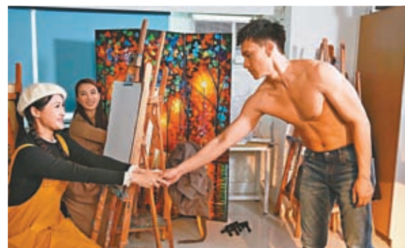
◆ 朱敏瀚這場戲剃得徹底，大晒肌肉。