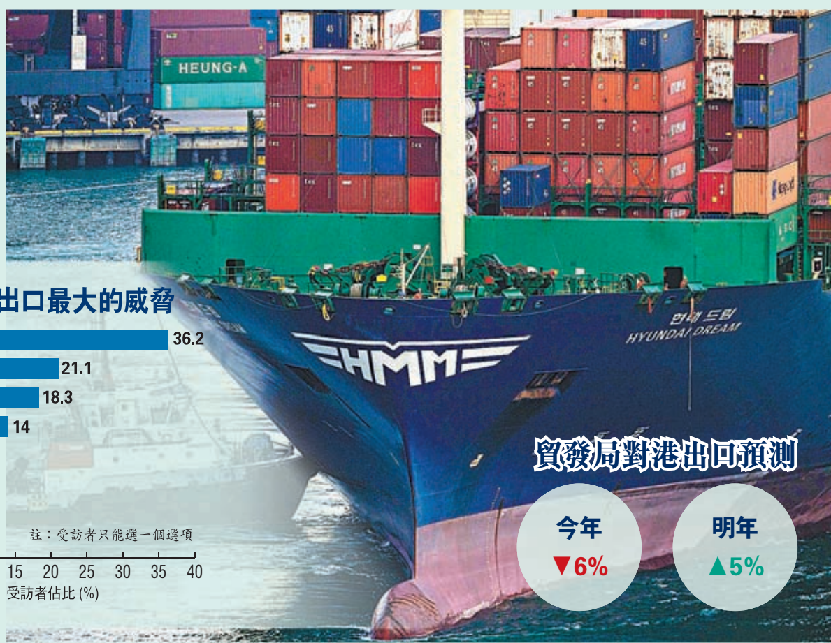
貿發局對港出口預測