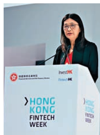
◆梁鳳儀表示，獲特首任命為下任香港證監會行政總裁，深感榮幸，將會繼續鞏固香港國際金融中心地位。資料圖片

梁鳳儀升遷之路頗為順遂，畢業於香港中大社會科學系的她，在哥倫比亞大學取得新聞碩士學位，曾於亞洲華爾街日報任職10年，1994年加入金管局，2000年升為金融管理局助理總裁。2008至2013年，成為首任財經事務及庫務局副局長，同時為香港貿易發展局財經事務諮詢委員會成員。2015年轉任證監會執行董事，掌管投資產品部，現為副行政總裁兼中介機構部執董。