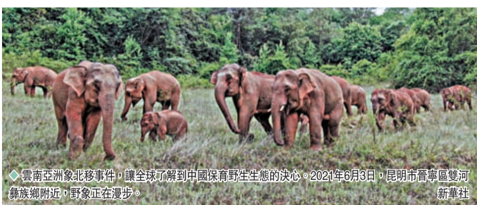
◆ 雲南亞洲象北移事件，讓全球了解到中國保育野生生態的決心。2021年6月3日，昆明市晉寧區雙河彝族鄉附近，野象正在漫步。