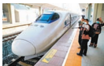
◆ 雲南彌蒙高鐵16日開通運營，乘客在紅河站拍照留念。

香港文匯報訊 據新華社，雲南彌蒙(勐)蒙(自)高鐵16日開通運營。該條高鐵北連南(寧)昆(明)高鐵，南接昆(明)河(口)鐵路，是中國西南地區出境至東盟國家鐵路大通道的重要組成部分。