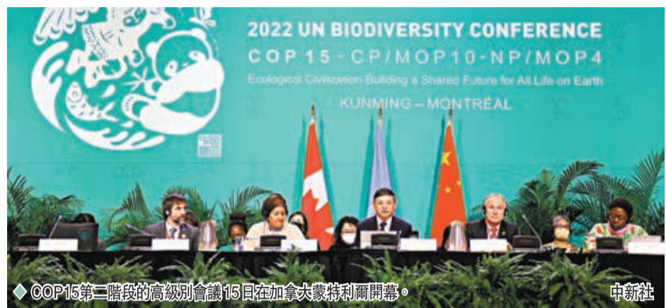
◆ COP15第二階段的高級別會議15日在加拿大蒙特利爾開幕。

香港文匯報訊 據新華社報道，《生物多樣性公約》第十五次締約方大會(COP15)第二階段的高級別會議15日在加拿大蒙特利爾開幕，中國國家主席習近平以視頻方式在開幕式上致辭。