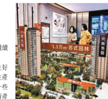
◆ 劉鶴指出房地產是國民經濟的支柱產業，正考慮新的舉措。圖為14日，市民在福建福州一處售樓部了解樓盤信息。

廣東省政府副秘書長張玉潤介紹，此次招商大會得到了國內外企業高度關注。包括埃克森美孚、巴斯夫、強生、沙特阿美、西門子能源、亞馬遜、沃爾瑪等世界知名企業代表，以及境內中國遠洋海運集團、美的、格力、中廣核、科大訊飛等知