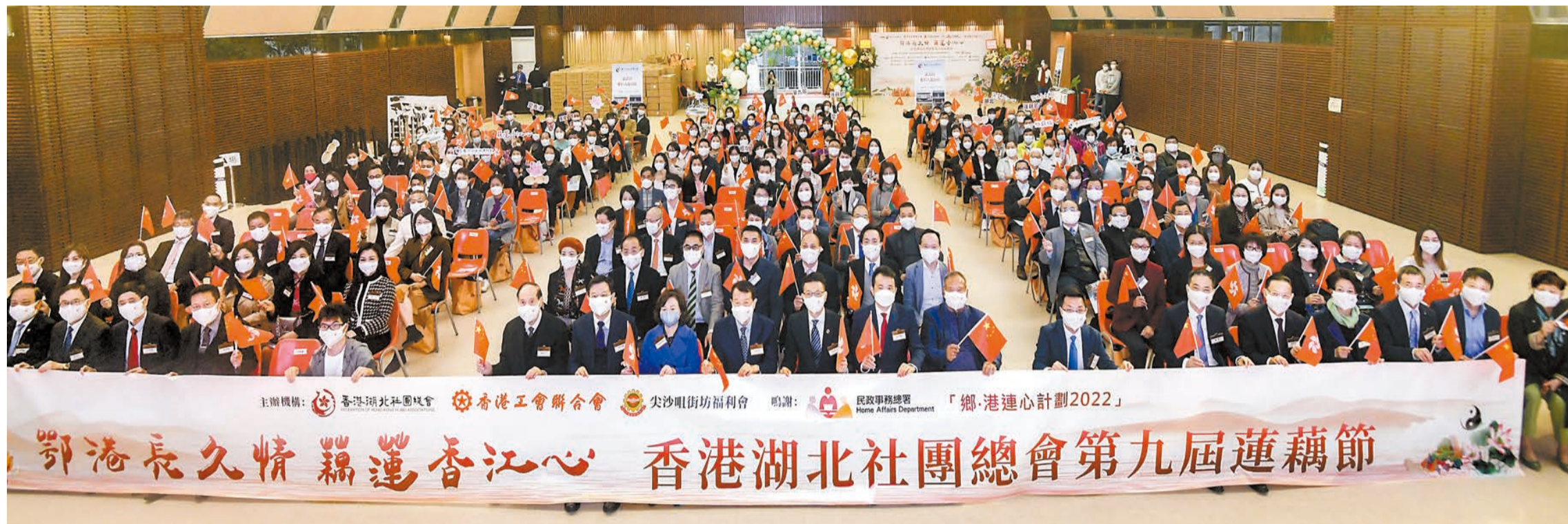
香港湖北社團總會舉辦第九屆蓮藕節，台上台下主禮嘉賓合影留念。

香港湖北社團總會舉辦第九屆蓮藕節，藉一碗蓮藕湯撫慰在港鄂籍鄉親，暖心暖情。是次活動於尖沙咀街坊福利會舉行，邀得民政事務總署署長張趙凱諭，政府勞工處副處長馮浩賢，中聯辦九龍工作部副部長祝小東，工聯會會長吳秋北，尖沙咀街坊福利會理事長蘇仲平，九龍社團聯會理事長徐莉，香港江西社團總會主席王再興等出席主禮。當天活動為出席的嘉賓和各位鄉親派發蓮藕，並送上豐富精彩的節目表演。本次活動作為特區政府民政事務總署「鄉·港連心計劃2022」支持的活動，由香港湖北社團總會、香港工會聯合會、尖沙咀街坊福利會主辦，由湖北省委統戰部、湖北省政協港澳台僑和外事委員會、湖北省人民政府港澳事務辦公室作為指導機構，中華人民共和國香港特別行政區政府駐武漢經濟貿易辦事處作為支持機構，華中師範大學香港校友會等16個總會轄下屬會協辦。