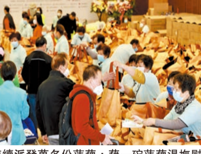
活動兩日連續派發萬多份蓮藕，藉一碗蓮藕湯撫慰在港鄂籍鄉親，暖心暖情。