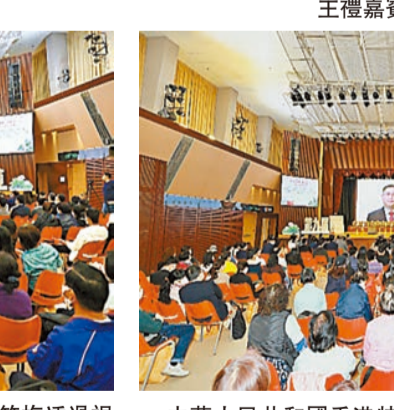
中華人民共和國香港特別行政區政府駐漢經濟貿易辦事處主任郭偉勳透過視頻致辭。