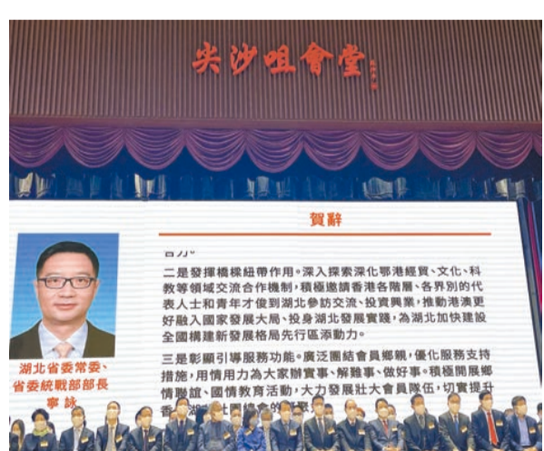
寧詠通過文稿表達對總會的祝福，對總會的工作充分肯定。