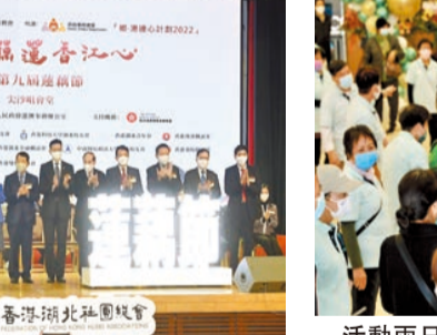
主禮嘉賓為活動舉行開幕亮燈儀式。