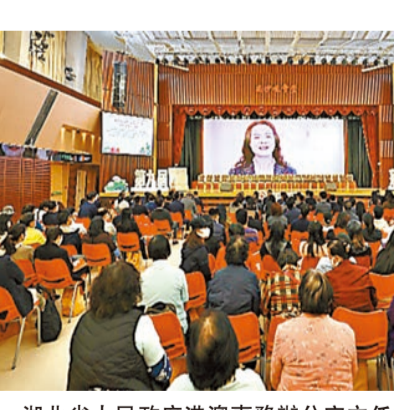
湖北省人民政府港澳事務辦公室主任章笑梅透過視頻致辭。

最暖家鄉情，絲絲蓮藕意，活動兩日連續派發11600份蓮藕，參與的義工近260人次，大家熱情高漲，分工合作，高效有力，令人感動！領到蓮藕禮包的鄂籍鄉親均喜笑顏開，大讚總會暖心暖情。