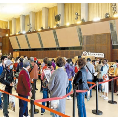
總會會員大排長龍領取蓮藕禮包。