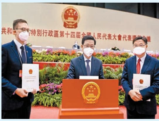
選舉會議主席團常務主席李家超投票。