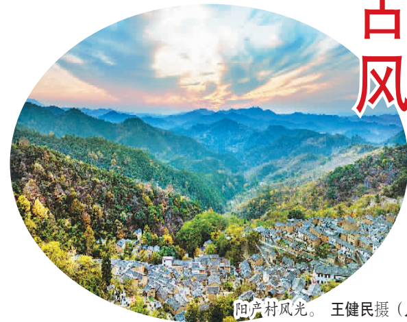
阳产村风光。

想起女儿的眼睛，每眨一下，就像一双小手在你的心间挠一下。土楼就像是童话里充满奇幻色彩的城堡。