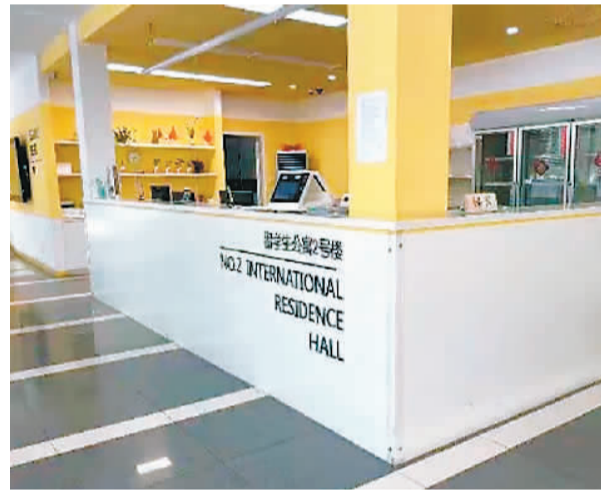
现实中的华东师范大学留学生公寓。