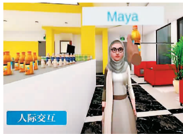
国际中文教育元宇宙中,学生在虚拟留学生公寓。