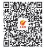
掃碼直擊口岸近況

港文匯報作出澄清，此組圖片是香港文匯報記者12日晚間7點-8點左右在福田口岸現場及周圍街道拍攝，並非資料舊圖。 香港文匯報將持續致力於客觀準確報道，就讀者關心的話題呈現第一手信息。