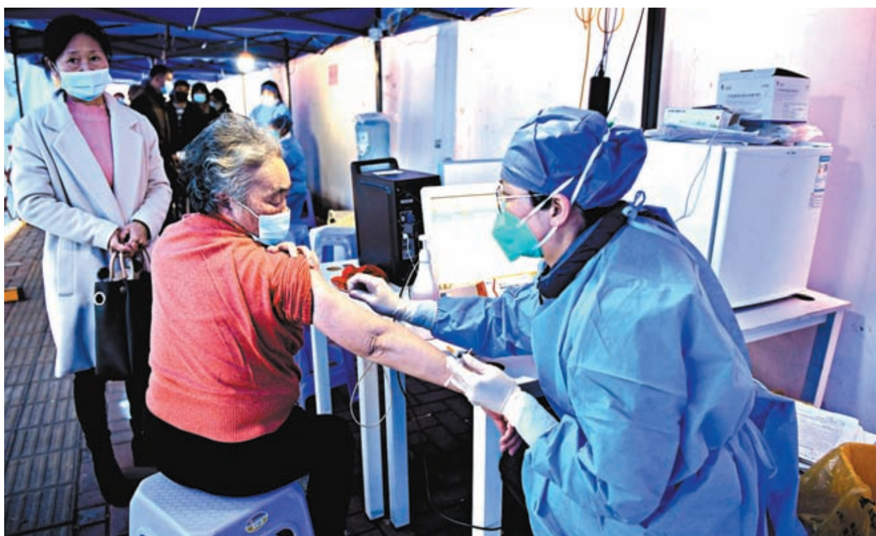
◆ 中國國務院聯防聯控機制12月14日發布新冠疫苗第二劑次加強免疫接種(第四針)實施方案，再次強調老年人接種第四針疫苗的必要。圖為12月14日福建福州市民接種新冠疫苗。

另據國家衛健委通報，當前，新冠肺炎核酸檢測實行順檢盡檢的策略，許多無症狀感染者不再參加核酸檢測，無法準確掌握無症狀感染者的實際數量，從12月14日起不再公布無症狀感染者數據。