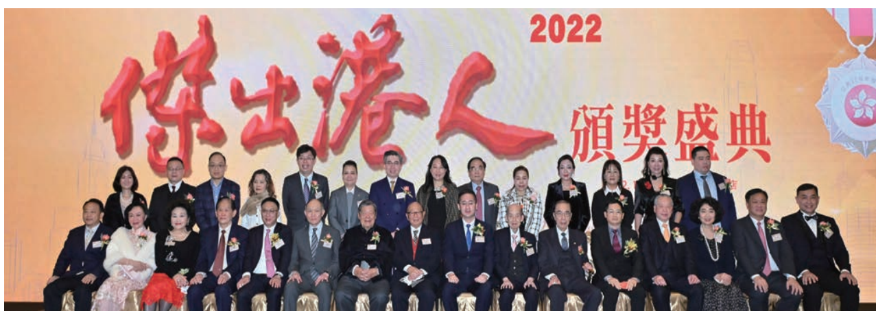
「回歸 25 年影響香港——傑出港人 2022 頒獎盛典」假香港嘉里酒店隆重舉行，實主大合照