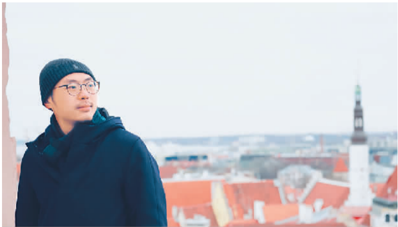
田益源留学时照片。