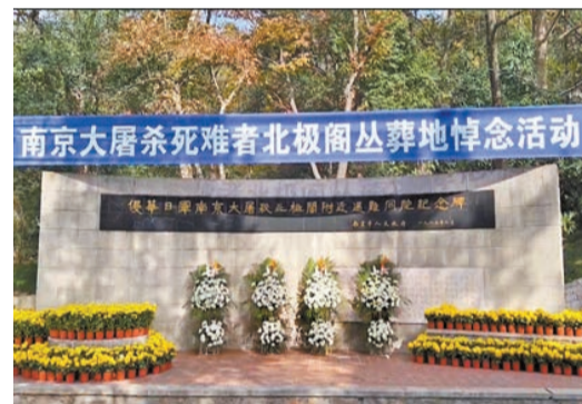
12月13日，南京各界人士在南京大屠殺北極閣叢葬地舉辦悼念活動。

蔡奇講話後，85名南京市青少年代表宣讀《和平宣言》，6名社會各界代表撞響「和平大鐘」。伴隨着3聲深沉的鐘聲，3000隻和平鴿展翅高飛，寄託着對死難者的無盡哀思和對世界和平的無限期許。