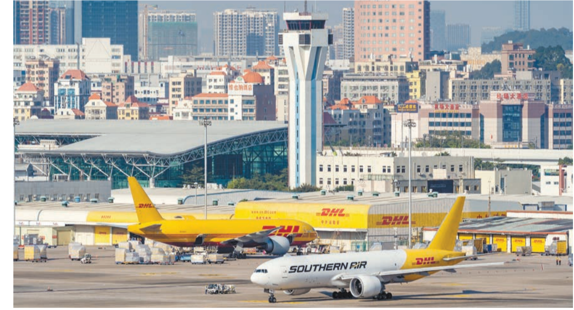
今年前11個月，深圳機場國際及地區貨運量同比增長21.1%。

深圳機場近日召開2022年度航空物流業務推介會。機場物流發展公司相關負責人在會上介紹，今年以來，深圳機場全力打造「全球123快貨物流圈」，目前，基本實現了深圳始發的國內貨物1天達遠，國際貨物最快2天內送達亞洲各主要城市、最快3天內送達亞洲以外的全球其他主要城市的目標。 今年前11個月，深圳機場聯合國內外航空公司新開了河