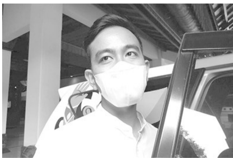
总统大公子、梭罗市长吉布兰