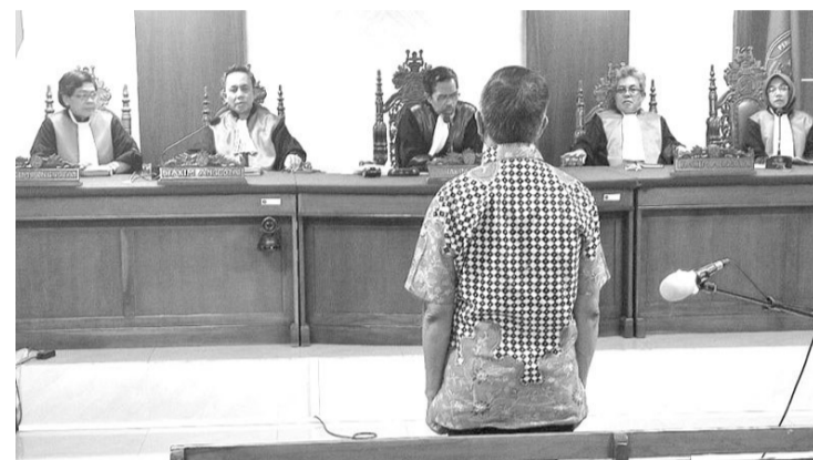
巴布亚省巴尼亚伊(Paniai)严重侵犯人权案件被告人被判无罪释放

【本报讯】巴布亚省巴尼亚伊(Paniai)严重侵犯人权案件被告人被判无罪释放。周四(9/12),伊萨克