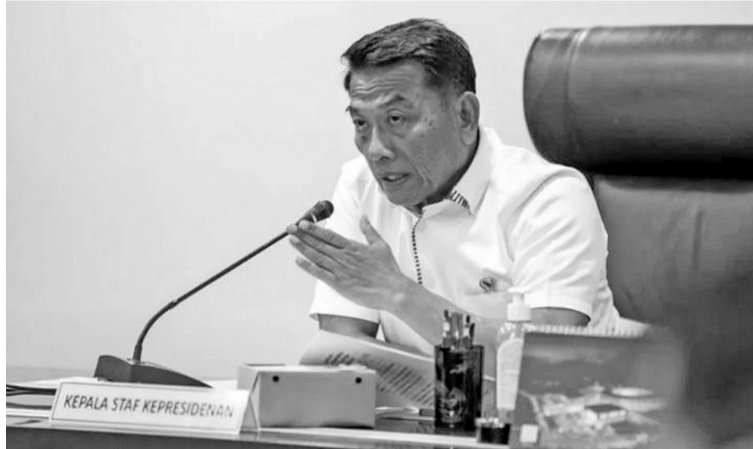
进口大米用以加强粮储局库存 总统府办公厅主任穆尔多科(Moeldoko)声称,进口大米用以加强粮储公共公司的库存。