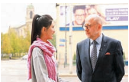
◆麥景榕在波蘭華沙拍攝《一帶一路醫藥行》訪問前波蘭駐華大使霍米茨基（右）。

士——前波蘭駐華大使霍米茨基，他也是中醫藥的支持者。原來大使的母親在上世紀七十年代，已經在針灸中心做助理，所以他自小就有機會接觸到中醫藥。他曾經試過肩膀痛，中醫師為他按摩穴位止痛，讓他嘖嘖稱奇。從此他開始中西醫雙管齊下，去調理自己的身體。「西醫有助解決症狀的問題，但我認為中醫有助根治我的問題。」他說。 霍米茨基大使任內致力促進中國和波蘭兩國間的合作，包括經濟及文化交流。究竟傳統的中醫藥在波蘭受歡迎嗎？他有什麼看法？「我認為『一帶一路』的倡議在經濟方面已發揮了作用。我們將會跟中國有更多的文化交流，當中包括傳統的中醫藥。」他充滿信心地說：「中醫藥在波蘭過去幾年發展很快，也愈來愈受歡迎。我認為中醫藥市場正在迅速發展，例如中醫師、中醫診所及在波蘭的中醫藥店舖。」