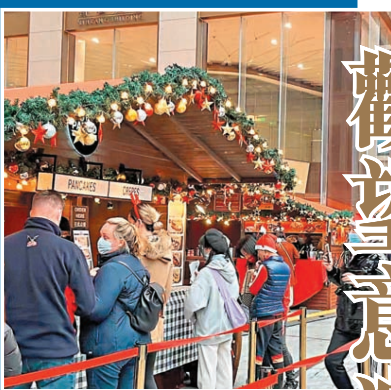
◆上周末在外灘市集出街的人群明顯增多，但多數看熱鬧。