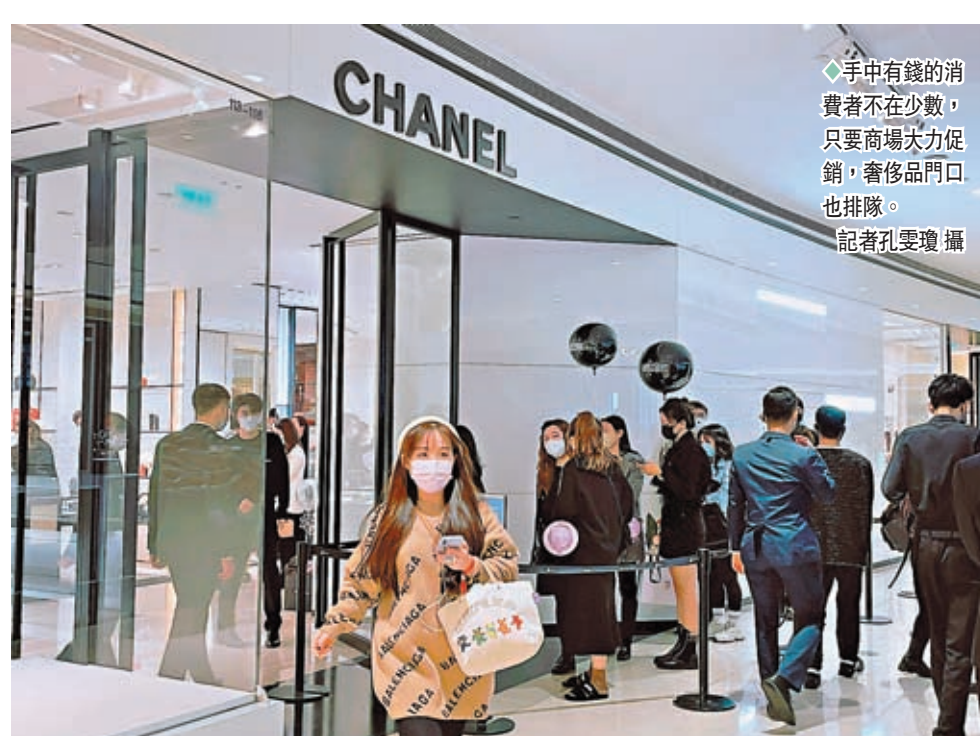
◆手中有錢的消費者不在少數，只要商場大力促銷，奢侈品門口也排隊。

上周末是上海不再對密閉娛樂場所、餐飲服務場所查驗核酸檢測陰性證明的首個周末。香港文匯報記者實地走訪了一些商場及餐飲店發現，隨着上海有序落實「新十條」，線下零售開始出現復甦跡象。然而儘管外出人流明顯增多，但店內人氣依然不夠旺，消費信心的恢復尚需一段時日。對於消費者花錢仍有猶豫，有專家認為人們的購買潛力仍在，待不確定性下降之後消費信心將會回來，有零售業界也認同「要等待消費者心態的放開」。 ◆香港文匯報記者 孔雯瓊 上海報道