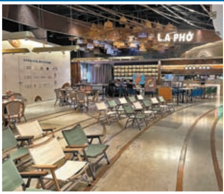
◆部分商場內餐飲堂食人數依然很少。