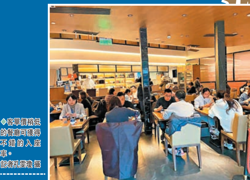
◆客單價稍低的餐廳可獲得不錯的入座率。