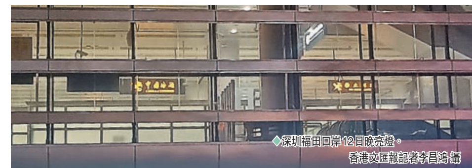
◆深圳福田口岸12日晚亮燈。

內外清潔 設備調試 香港文匯報記者12日晚7點半在福田口岸採訪時看到，福田口岸前往香港方向的二樓和三樓燈火通明。記者採訪口岸保安和地鐵安保人員等均表示，目前口岸在做外牆和室內清潔，以及燈光調試、設備調試，籌備迎接兩地重新恢復通關。 福田口岸地鐵站一保安表示，看到福田口岸地鐵有關工作人員在口岸做籌備工作。一位在福田口岸從事保潔的李先生表示，現在內地疫情放開管控，口岸裏面在打掃衛生和做一些設備整理，為通關做