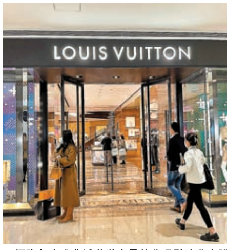
◆恒隆年度盛典活動送大量積分吸引消費者購買。

儘管完全復甦尚待時日，但零售業界的從業者卻信心挺足。不少商場目前都在積極籌劃年底的活動，還有人預計，最快本月聖誕節、最遲明年春節前後，復甦性消費一定會來臨。