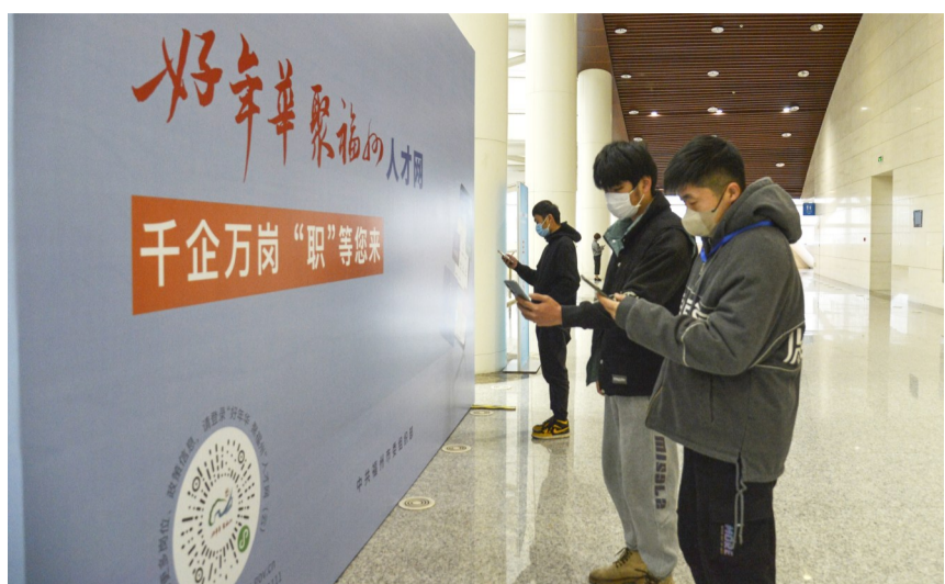
扫描二维码,千企万岗“职”等你来。