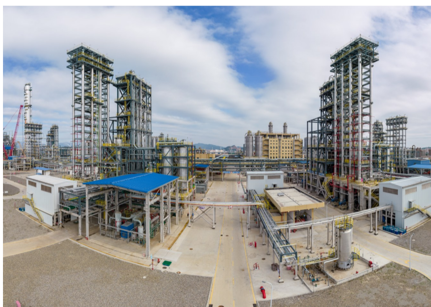
全球最大的年产120万吨多元共聚聚丙烯装置。