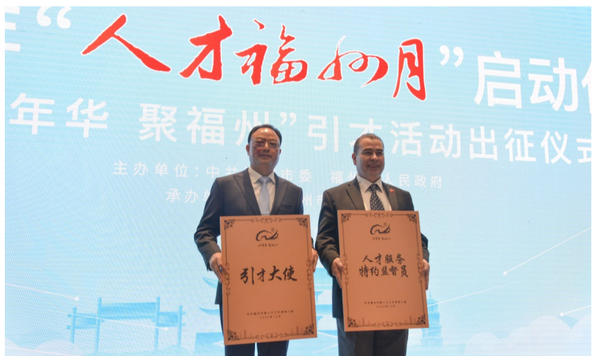
“引才大使”“人才服务特约监督员”代表。

【福州晚报讯】中国共产党的二十大报告提出,必须坚持科技是第一生产力、人才是第一资源、创新是第一动力。福州坚持为人才搭建桥梁,为发展开拓赛道。