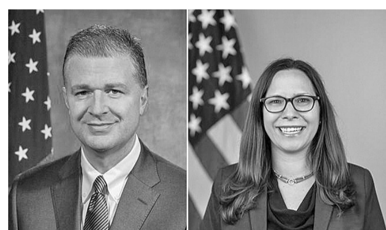
康达(左)和罗森伯格(右)

【环球时报讯】美国国务院10日宣布助理国务卿康达和国家安全委员会中国事务主任罗森伯格11日起访问东亚。