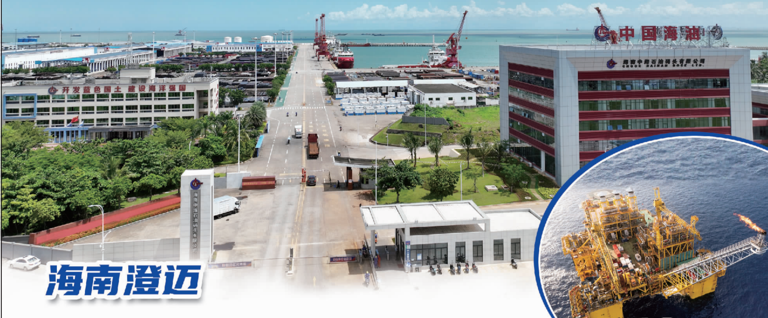
中海油海南澄迈马村港作业码头全景