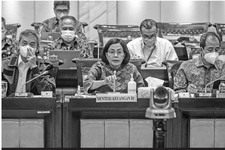
财长参加国会第十一委员会工作会议 财政部长穆丽亚妮(Sri Mulyani Indrawati / 中)在雅加达国会大厦参加国会十一委员会的工作会议,讨论关于2023年烟草制品印花税政策事项。

他在计算2023年最低工资时提到,将根据2021年第1517号省长决定书,以2022年最低工资460万盾作为参考标准。(Irw)